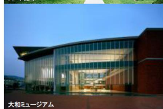
大和ミュージアム