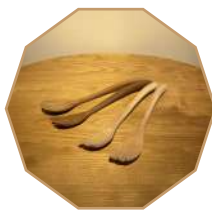
サービングスプーン