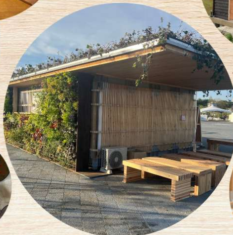
△青葉山公園案内所