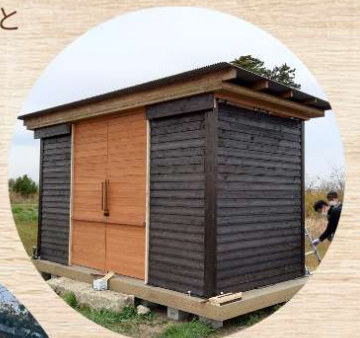
△深沼ウッドガレージ

また、様々な団体と協力しながら木造建築を普及させるための取り組みを行っています。